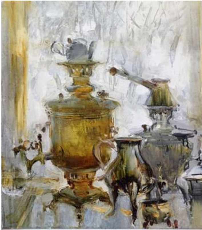
Рисунок 9 - Натюрморт. Виконала здобувачка освіти Т. Папушнікова. Полотно/олія, розмір 80х60 см