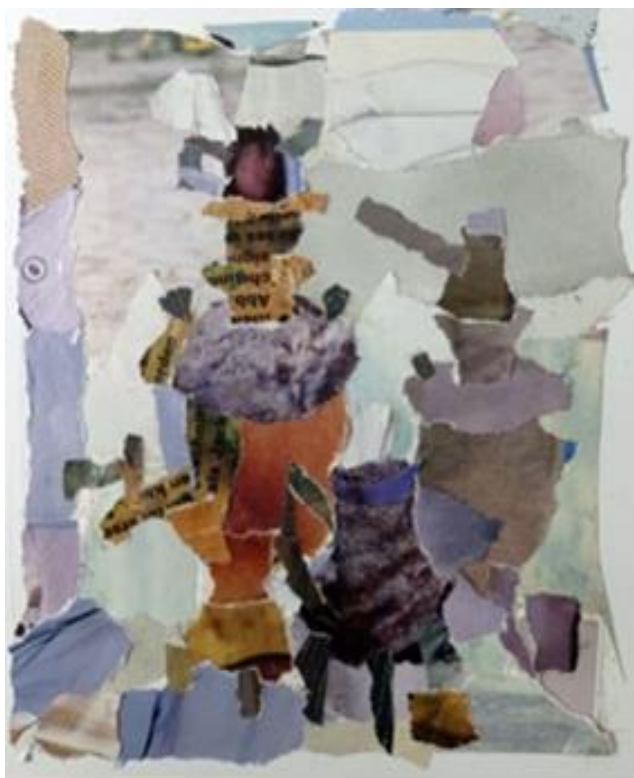
Рисунок 6 - Колаж. Композиційні пошуки до натюрморту. Виконала здобувачка освіти Т. Папушнікова, розмір 12x10 см