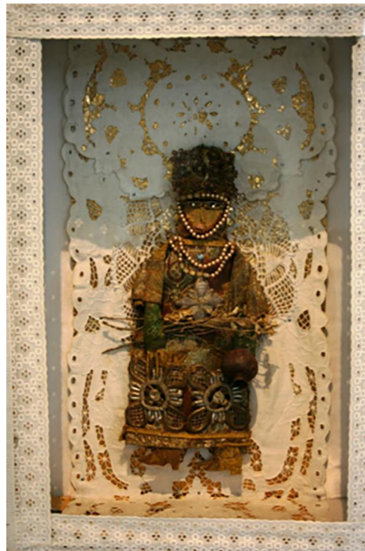
Рисунок 1.3 - Колаж. Лялька до фільму «Колір гранату» (С. Параджанов, 1968 р.)

До колажу близькі за жанром такі види мистецтва: