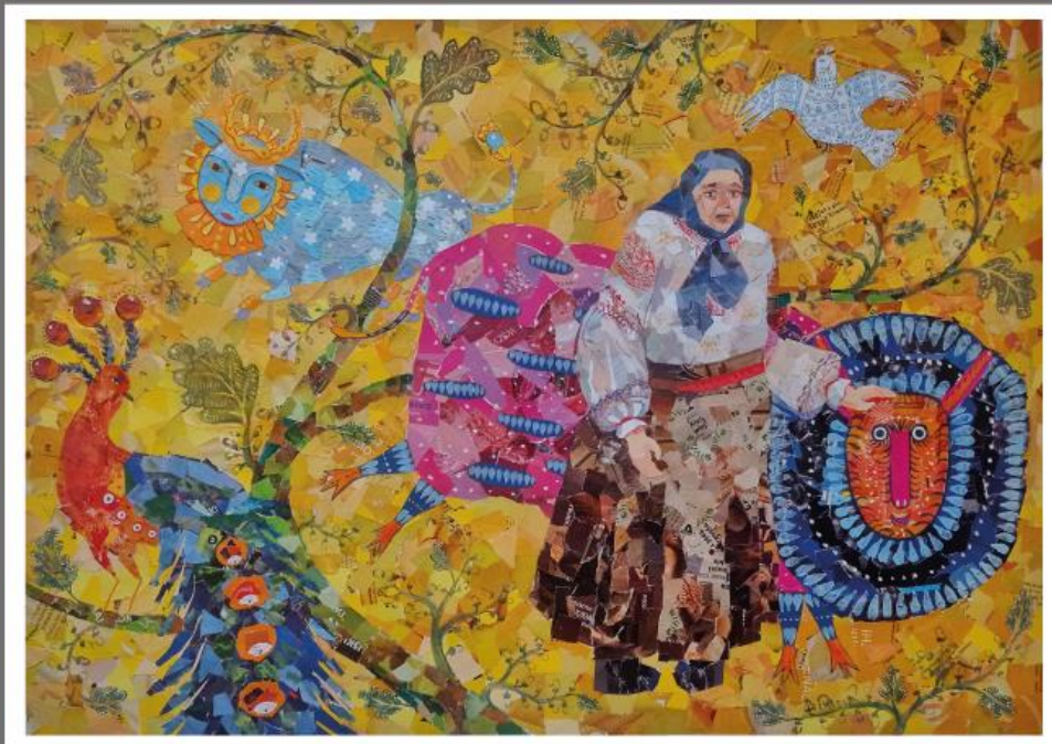
Рисунок 14 – Колаж. Дипломна робота. Виконала здобувачка освіти К. Терещук, розмір 70x50см.