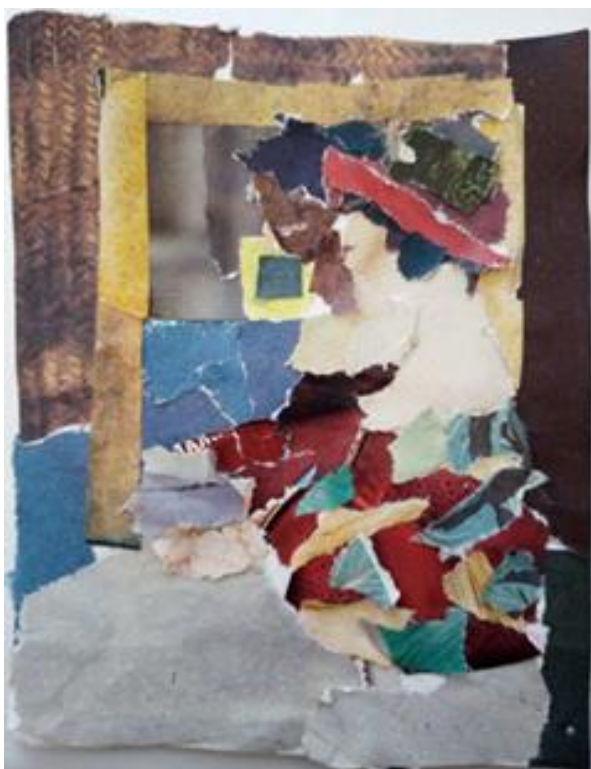
Рисунок 3 - Композиційний аналіз аналогів. Колаж у кольорі. Виконала здобувачка освіти Д. Тимофєєва