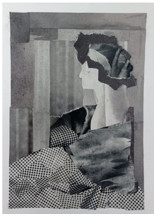
Рисунок 2 - Композиційний аналіз аналогів. Колаж. Розбір на 3-4 тони. Виконала здобувачка освіти Д. Тимофєєва