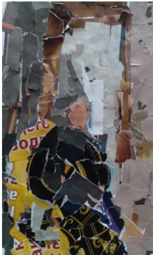
Рисунок 10 - Колаж. Композиційні пошуки. Виконав здобувач освіти К. Соловійов-Жирко, розмір 18х10 см