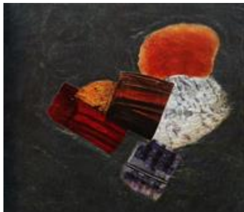
Рисунок 1.1 - Живописна інтерпретація текстур (М. Бронштейн, 1920 р.)

Колажі з різних матеріалів і об'ємні рельєфні композиції, побудовані на контрастах гладкого – шорсткого, блискучого – матового, прозорого – глиняного, - сприяють розвитку уваги до текстур та їхньої візуальної та тактильної виразності, розвитку образності мислення ( рисунок 1.1 ).