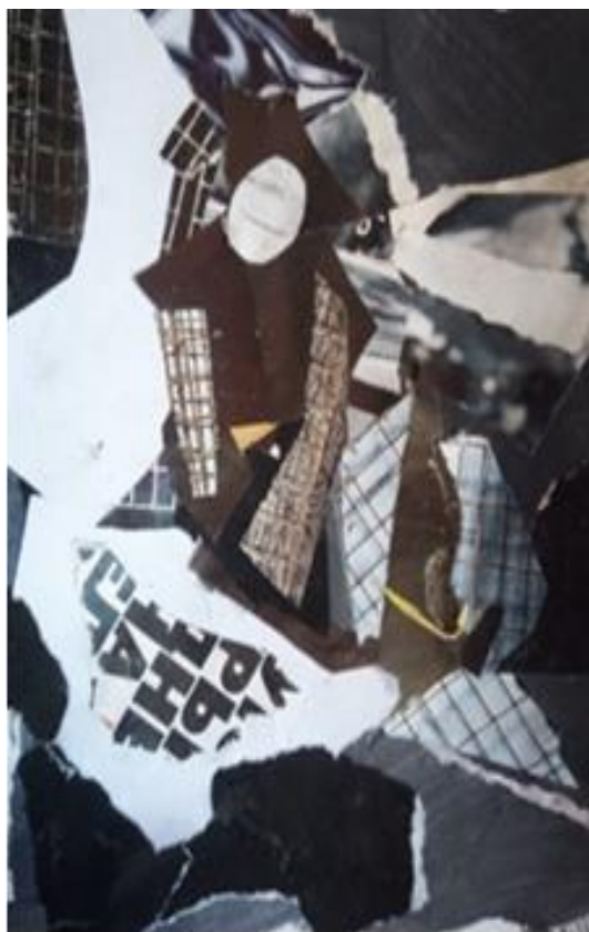
Рисунок 12 - Колаж. Композиційні пошуки. Виконала здобувачка освіти Д. Тимофєєва