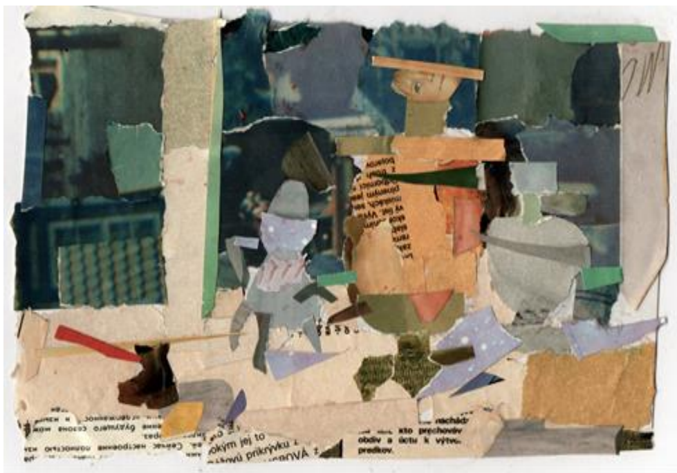
Рисунок 7 – Колаж. Композиційні пошуки до натюрморту. Виконала здобувачка освіти Т. Папушнікова, розмір 14x20 см