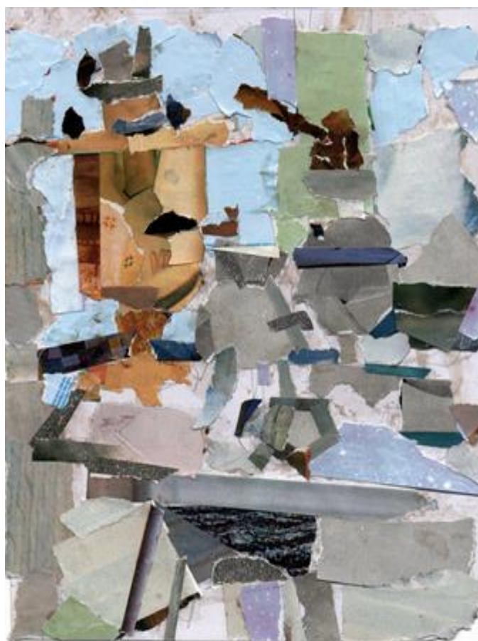
Рисунок 8 – Колаж. Композиційні пошуки до натюрморту. Виконала здобувачка освіти Т. Папушнікова, розмір 15x10 см