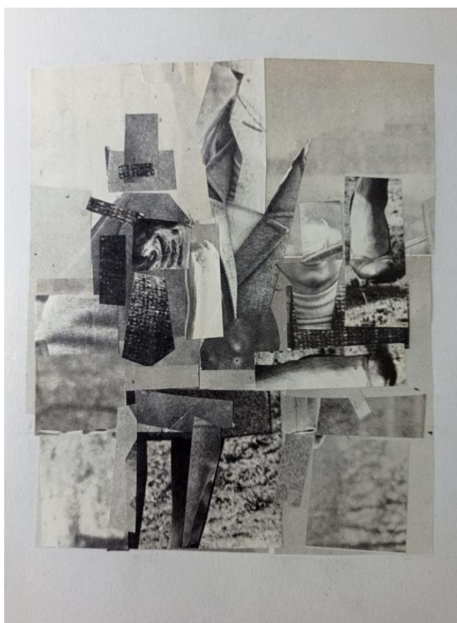
Рисунок 4 - Колаж. Розбір на 3-4 тони. Виконала здобувачка освіти Т. Папушнікова, розмір 14,5 x 12 см