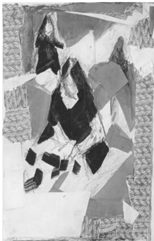
Рисунок 13 - Колаж. Композиційні пошуки. Виконала здобувачка освіти Д. Тимофєєва