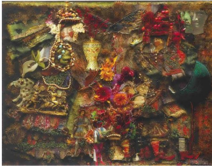
Рисунок 1.2 - Колаж із зображенням гуцула і гуцулки до фільму «Тіні забутих предків» (С. Параджанов, 1964 р.)