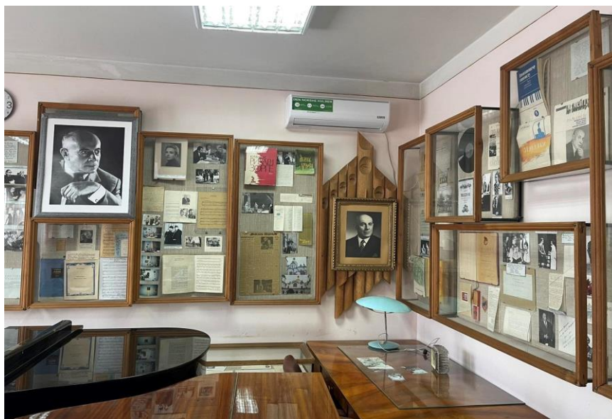
Народний меморіальний музей Ю. С. Мейтуса

Музика циклу Юлія Мейтуса «12 дитячих п'єс для фортепіано» вирізняється яскравою образністю, різноманітними гармонічними та тембральними засобами виразності, широким арсеналом метро-ритмічних та інтонаційно-ладових знахідок. Збірка, що присвячена онукові композитора, є віддзеркаленням світу дитинства, мрій, казок і природи.