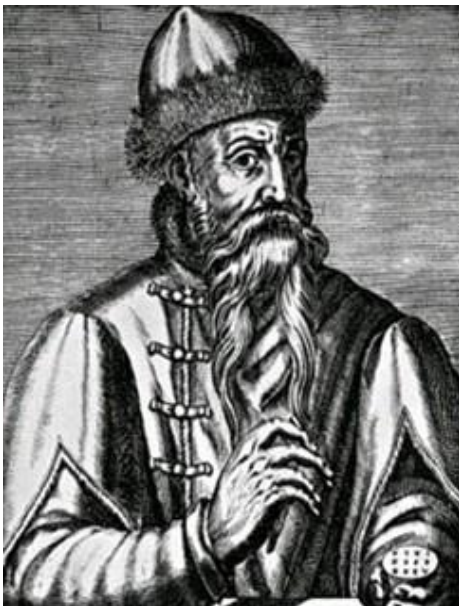
Йоганн Гутенберг (XV ст.)

У XIII столітті таємницю виготовлення паперу в китайців дізналися араби. Знання виробництва паперу почало поширюватися в Європі. Навіть до цього часу пергамент, що виготовляли із шкіри тварин, залишався дуже коштовним. Так, для виробництва однієї Біблії було потрібно близько 300 овечих шкур. Ручне виробництво паперу в Європі тривало більш 700 років. Значне розширення виробництва та споживання паперу в історії його виникнення пов'язано з 1456 роком, коли Йоганн Гутенберг надрукував першу Біблію.