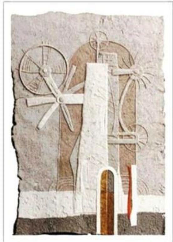
Роботи сучасного художника Латіфа Казбекова (ручне лиття паперу)